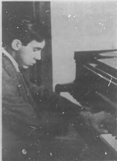
SR. MANUEL SIERRA MARGANA Notable pianista mexicano que dará el 22 del actual un concierto en la Sala "Espadero" del Conservatorio Nacional.

Tiple lírica de la Compañía de Ópera que actúa en el Metropolitan House, de New York, en el papel de "Mimi", de la ópera "Bohemia", de Puccini.