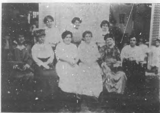
CRECHE DEL VEDADO.—Damas protectoras y fundadoras de la “Creche” del Vedado.

“Historia de la Esclavitud”. Se precisa reunir en el término de dos años $20,000 que es la cantidad presupuesta para el coste de la estatua, y para que