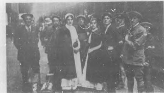
Las damas inglesas de la Cruz Roja, al partir para Bélgica.

qué esmero la lavaban, la taponaban y con qué inexplicable maestría sus manos—aquellas manos profanas días antes—ponían la venda nueva que había de asegurar la cura!