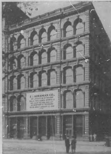
Nuevo edificio de la importante casa E. I. Horstman Co. de New York, del que nos ocupamos en otro lugar.