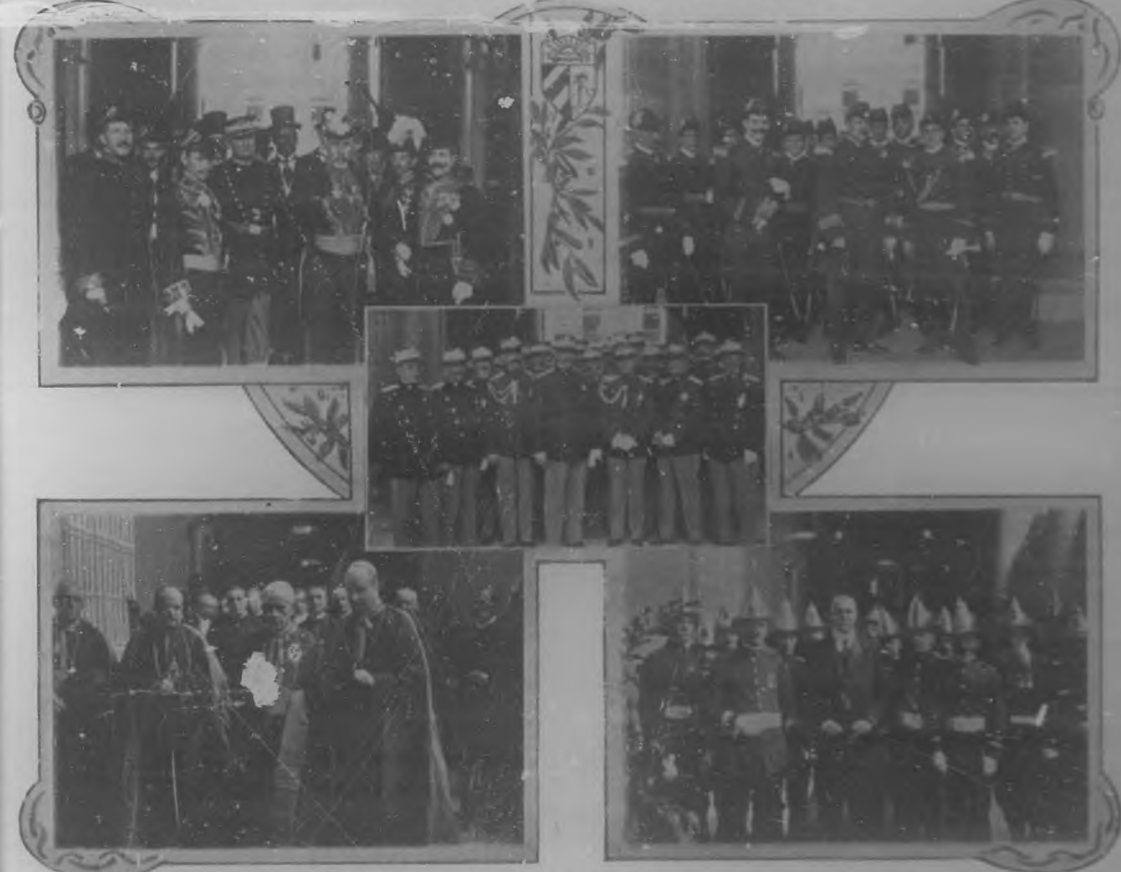
LA RECEPCION DE AÑO NUEVO EN PALACIO.—Visita del Cuerpo Diplomático, Marina Nacional, Cuerpo de Policía, Clero y Cuerpo de Bomberos de la Habana, después de haber cumplimentado al Sr. Presidente de la República, con motivo del nuevo año.