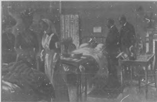
Simpatía de los reyes de Inglaterra por las heroicas damas de la Cruz Roja. —Los reyes de Inglaterra y el príncipe Enrique de Battenberg en un hospital.

Yo las he visto arrodilladas lavando los pies de los heridos, aquellos pies cansados, abiertos, llenos de lodo y de sangre. ¡ Con qué delicadeza deshacían los viejos vendajes, aquellos vendajes que el herido se hiciera a sí mismo en el campo de batalla, para no arrancar ni una sola queja, ni un solo grito; con qué admirable valor ponían al descubierto la sangrienta herida, a veces horrible y purulenta; con