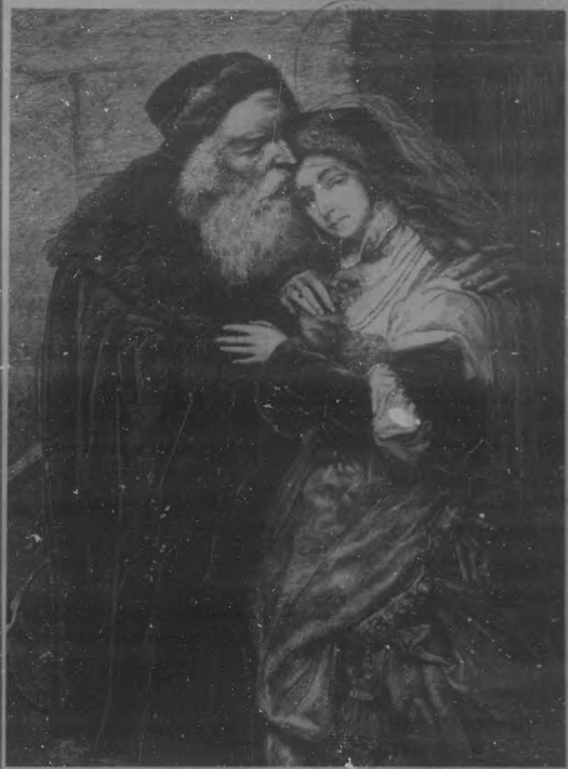
LA HIJA DEL JUDIO Cuadro de M. Gottlieb.