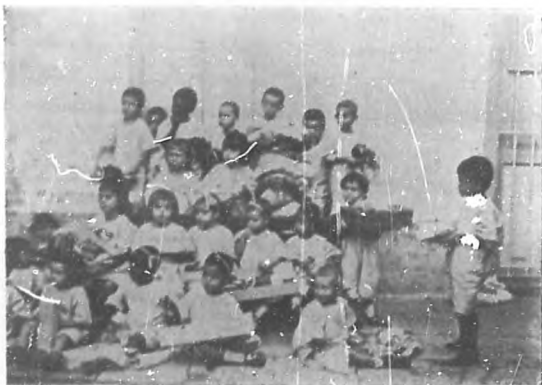
CRECHE DEL VEDADO.—Niños que obtuvieron juguetes en el árbol de Navidad en esta “Creche”.

pensador, circulará costeada por “Cuba Contemporánea” una edición completa de las obras del esclarecido autor de la