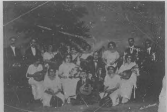
EN EL TEATRO DE "SANTOS Y ARTIGAS" DE SAGUA.—Grupo de la estudiantina "Esquadero", compuesta por elementos prestigiosos de aquella Sociedad, que tomaron parte en el concierto "Falcón-Torroella", celebrado con ruidoso éxito en la noche del 21 del pasado mes.

Su hoja de méritos y servicios profesionales, no puede ser