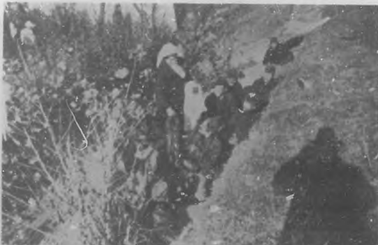
Las damas de la Cruz Roja visitando a los soldados belgas, en las trincheras de Dixmunde.